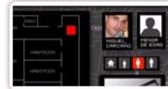
Crimen de Marta del Castillo