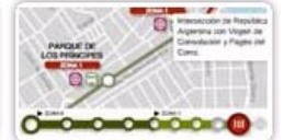
METRO de Sevilla

GALERÍAS GRÁFICAS | CANALES | BLOGS | PARTICIPACIÓN | HEMEROTECA | BOLETÍN | ESPECIALES | MAPA WEB