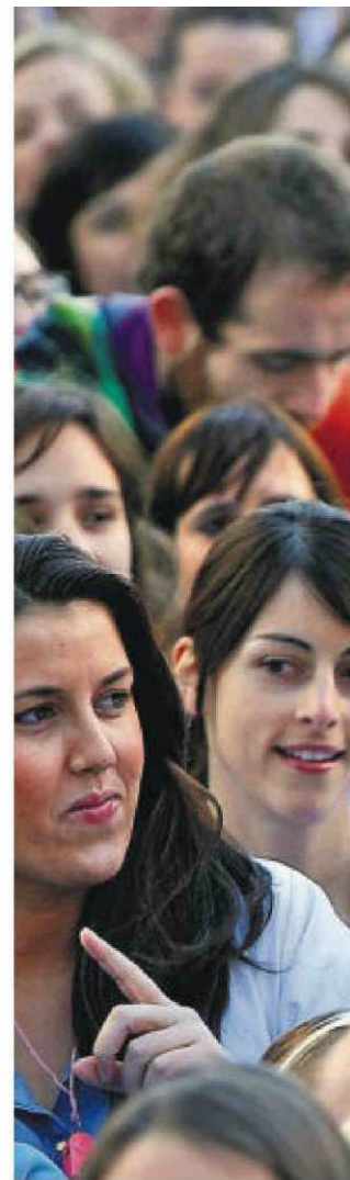
Movilización de personal del hospital 12 de Octubre contra la privatización de la sanidad madrileña.

Para Pablo Iglesias, doctor en Ciencias Políticas de la Complutense, el problema está más en quién y cómo se dan las subvenciones que en quienes las reciben: "Lo público va más allá de lo insti-