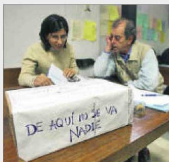
Protesta en San Carlos Borromeo.

► En el verano de 2011 comenzó a gestarse el movimiento de la marea verde , la protesta de la comunidad educativa contra los recortes de la Comunidad de Madrid en educación. La consejería expidió a directores y profesores por llevar camisetas verdes en exámenes o poner carteles. Varios docentes fueron trasladados a peores destinos por denunciar a la prensa sus