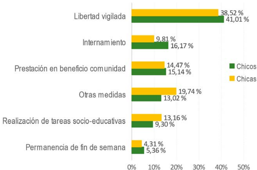
Gráfico 31. Distribución del tipo de medidas adoptadas según sexo. Andalucía, 2014