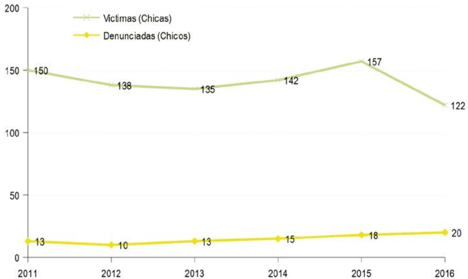
Gráfico 27. Evolución de la violencia de género en personas menores de 18 años en Andalucía: víctimas y denunciadas. 2011-2016

Nota: Resultados referidos a asuntos (con medidas cautelares dictadas)