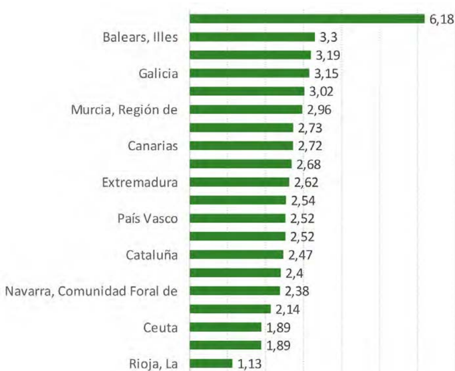
Gráfico 8. Tasa de mortalidad infantil según comunidad autónoma. España, 2016