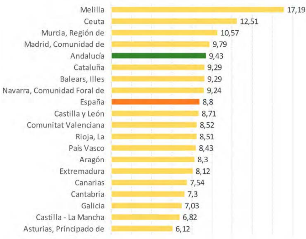
Gráfico 5, Tasa bruta de natalidad según comunidad autónoma. España, 2016

Fuente: Observatorio de la Infancia en Andalucía a partir de Indicadores demográficos básicos 2016. INE