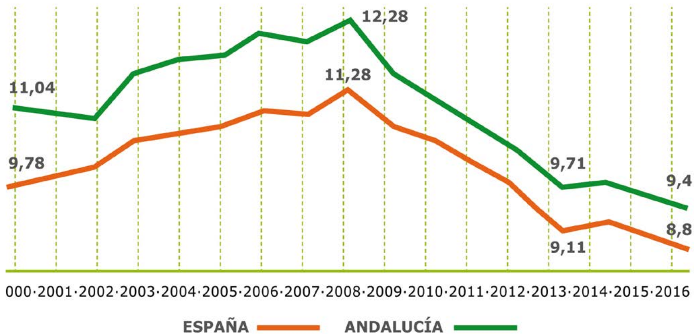
Gráfico 7. Evolución de la tasa bruta de natalidad. España y Andalucía, 2000 - 2016

Fuente: Observatorio de la Infancia en Andalucía a partir de Indicadores demográficos básicos 2016. INE