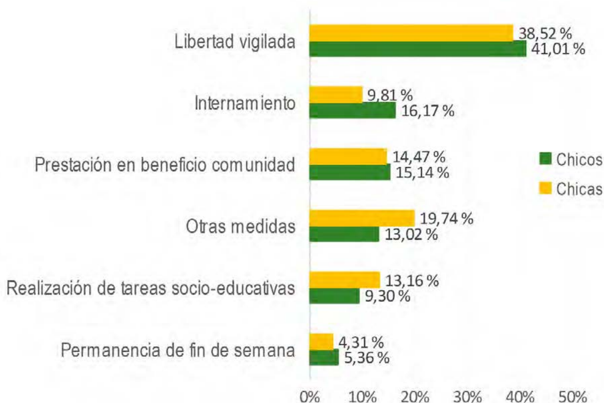
Gráfico 31. Distribución del tipo de medidas adoptadas según sexo. Andalucía, 2014