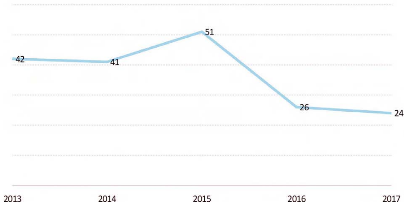
Gráfico 26. Evolución del número de personas menores de 18 años cuyas madres han sido asesinadas por violencia de género. España 2013-2017

Fuente: Observatorio de la Infancia en Andalucía a partir de Fichas de víctimas mortales por violencia de género. Delegación del Gobierno para la Violencia de Género. Ministerio de Sanidad, Servicios Sociales e Igualdad.