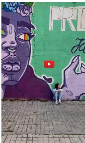
Vídeo mención accésit XVI Edición del Premio

Por su parte, el accésit para esta modalidad ha sido concedido al trabajo presentado por el alumnado 4º Secundaria del I.E.S. Jabalruz de Jaén, representando el derecho de asociarse