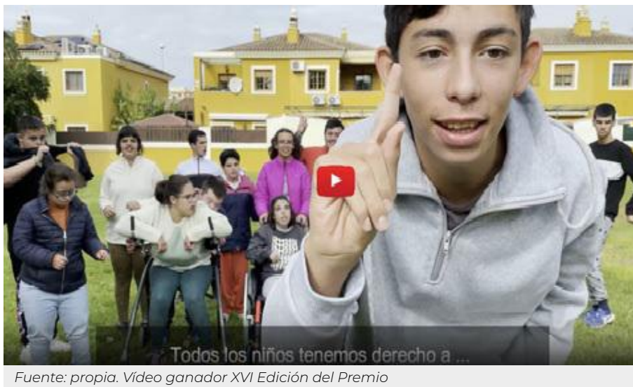
Vídeo ganador XVI Edición del Premio

b) En la modalidad de vídeo , el Jurado acordó otorgar el premio al alumnado de 6º Educación Especial, del C.D.P.E.E. San Juan de Dios de Alcalá Guadaíra (Sevilla) , representando el derecho a la Educación y Juego .