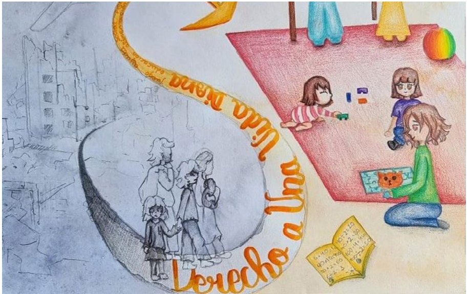
Dibujo ganador XVI Edición del Premio