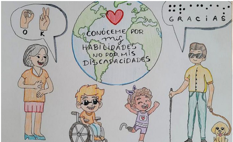
Dibujo mención accesit XVI Edición del Premio