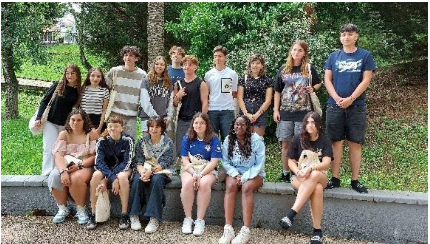
Fuente: propia. Defensoría de la Infancia y Adolescencia de Andalucía

Elaboraron un vídeo que ilustra el proceso de reflexión realizado, la ilusión y las ganas para llegar a sus conclusiones y en el que interpelan a las defensorías a continuar trabajando sin cesar por los derechos de niños, niñas y adolescentes : “les pedimos que se nos tome más en cuenta” y “que sigan trabajando para defender los derechos de niños, niñas y adolescentes” .