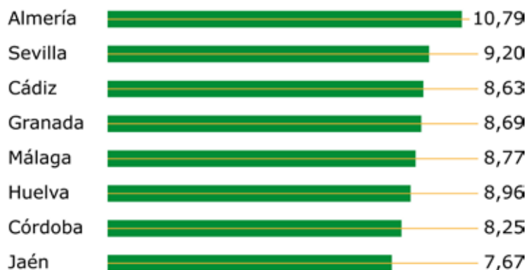
Gráfico 6. Tasa bruta de natalidad según provincia. Andalucía, 2017

Fuente: Observatorio de la Infancia en Andalucía a partir de Indicadores demográficos básicos 2017. INE