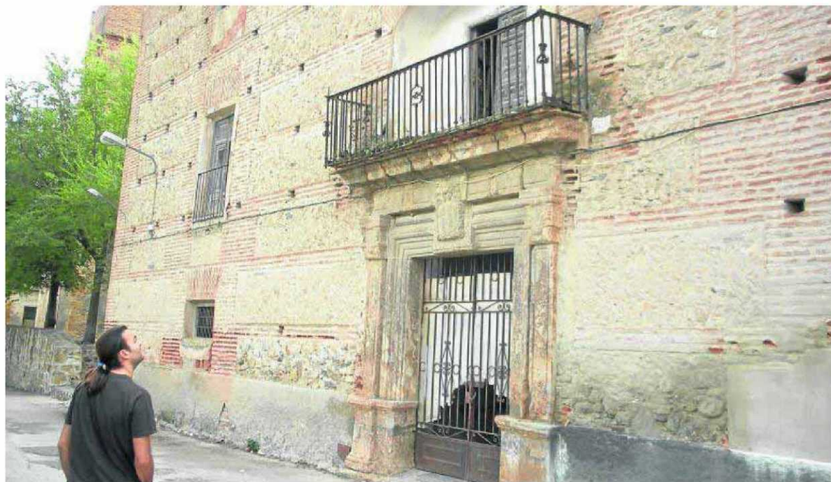
La casa presenta en su fachada el escudo de la familia de los Palomar, que la construyó en el siglo XVIII.

Y es que en el Boletín Oficial de la Junta de Andalucía de 12 de julio de 2007 se le atribuye «valores testimoniales de amplia significación, al tratarse de la vivienda donde residió Juan de Austria durante el tiempo que duró la persecución de los moriscos en la zona», algo que «nunca pudo suceder, al igual que tampoco fue donde vivió el rey Boabdil, ya que