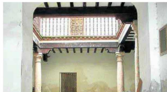
Arriba, el anuncio; abajo, el interior de la casa.

son dos personajes anteriores a la construcción de la casa. La 'Casa Grande' se construyó en 1741. Boabdil llevaba más de doscientos años muerto. La casa la construyó la familia Palomar, tenemos varios documentos que lo prueban. Y nada hace indicar que alguna de las dos casas que anteriormente ocupaban el solar fueran el famoso palacio: ni el tamaño de las