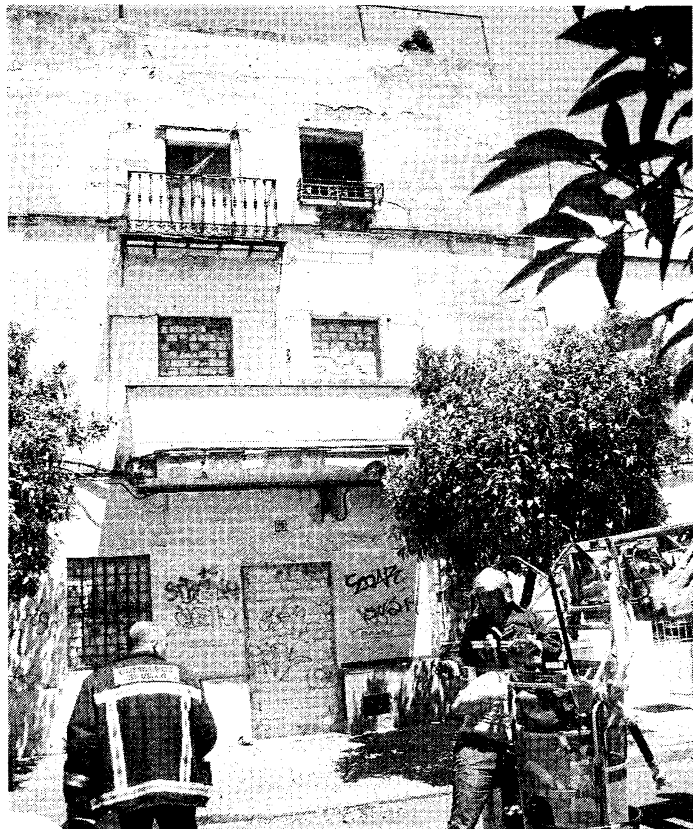
Los Bomberos trabajan en la casa derrumbada.